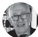
Philippe Belaval Cabinet du Président de La République