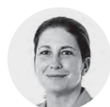
Laure Darcos Sénatrice