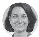
Isabelle Rauch Députée