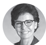
Rachida Dati Ministre de la Culture