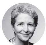
Laure de la Raudière ARCEP